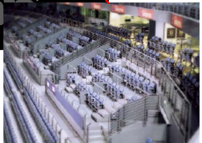
Бизнес-места Блок 306